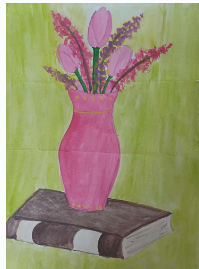
Urtė Šatinskaitė, 7 kl.