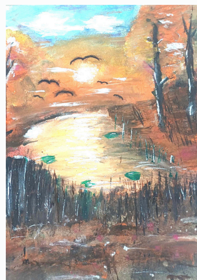
Goda Jučaitė, 10 b kl.