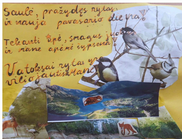
Rusnė Kruzaitė, Vincentas Gavlik, 5 a kl.